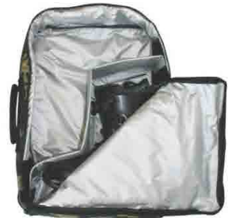
仕切りパッドは 取り外し可能!!