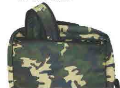
ショルダーを収納 するとスッキリ♪