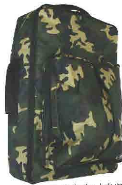
ヘルメットを収納 してもスッキリ♪