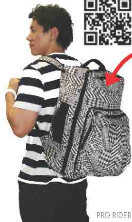
PRO RIDER KIZAKI