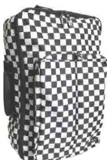
B.CHK ブラックチェック