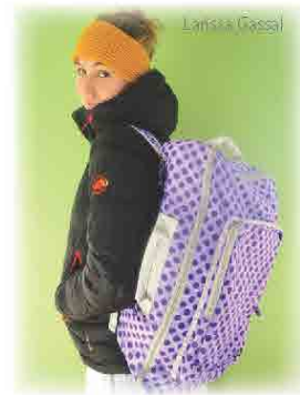
スイス・プロライダー ラリッサ・ガッサール